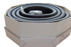
Scatola fino a 25 mt