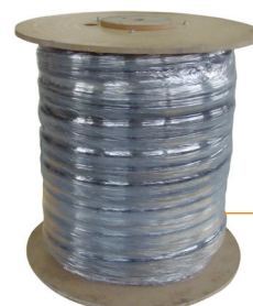
Bobina SU MISURA da 25 a 50 mt.

i prezzi sono iva esclusa CERTIFICATO SPF nr. J108HOS - Rapperswil